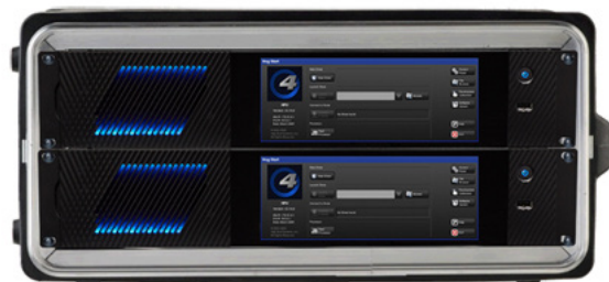
2台をラックへ組み込み (プロセッサモード)