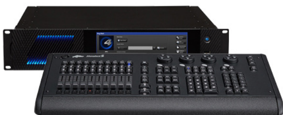
Hoglet 4 との組み合わせ (コンソールモード)